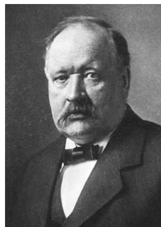
Svante Arrhenius, Ulf von Eulers gudfar. Nobelpristagare i kemi 1903.

hon professor i biologi vid Uppsala universitet.